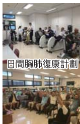
日間胸肺復康計劃