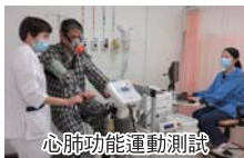
心肺功能運動測試