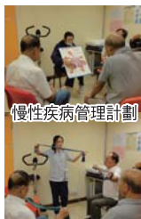
慢性疾病管理計劃