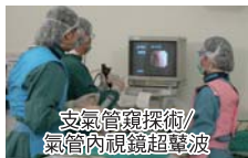
支氣管窺探術/ 氣管內視鏡超聲波