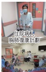
住院病人 胸肺復康計劃