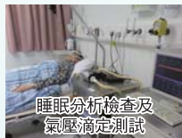
睡眠分析檢查及 氣壓測定測試

設有睡眠診斷部，採用符合國際的標準及技術，以協助診斷及治療，使病人能儘快得到適當醫治及復康計劃