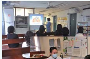
4.2 轉介醫務社會服務