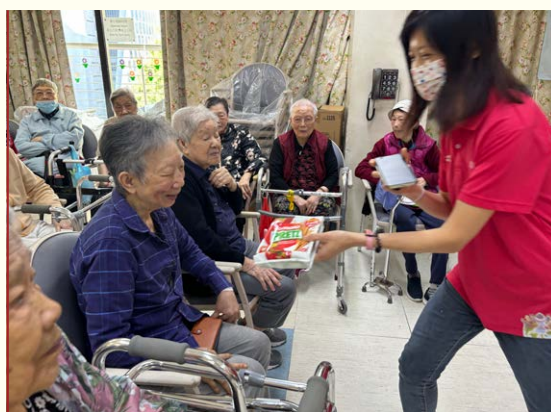
鐵路人鐵路心義工探訪 — 港鐵義工隊