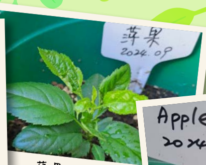
蘋果 2 個月大