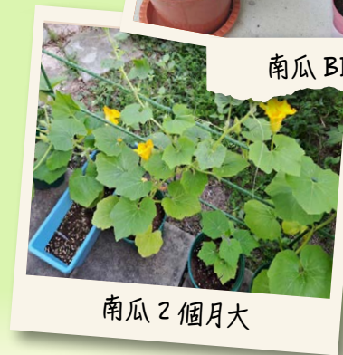
南瓜 2 個月大