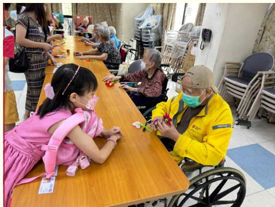
「青年耆織」義工探訪 — 循道衛理楊震社會服務處油尖旺青少年綜合發展中心

本院歡迎各義工團體到本院探訪，他們為院友安排不同形式的表演，也會與院友們一起做手工，共度歡樂時光。