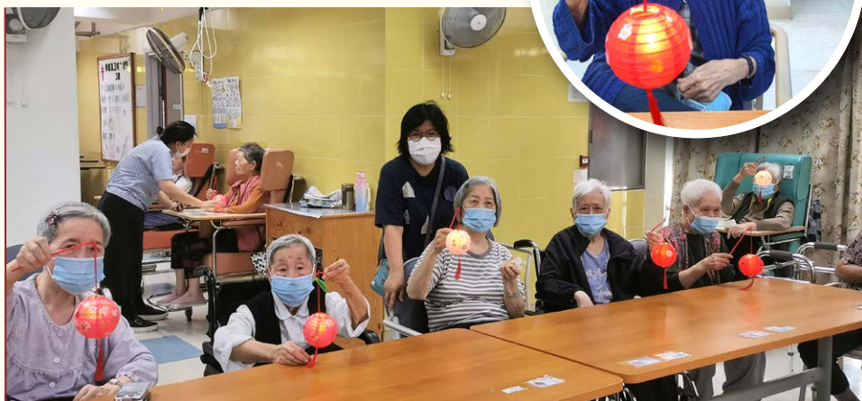
信望愛福音義工探訪 — 信望愛福音會(北角堂)