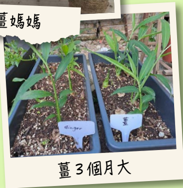
薑 3 個月大

院舍正計劃與院友們一起打造花園，並悉心培育各式各樣的幼苗，稍後會邀請院友們協助淋花，一同見證它們的成長。各位院友與家人到花園閒逛時，亦可看看它們的生長情況，更賞心悅目呢！